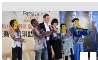
蜜拉喬娃維琪偕夫訪台 一家 ...