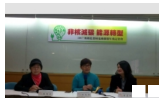
媽盟籲再修電業法 速分割台 ...