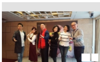
國光重現「孟麗君」青年旦 ...