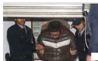
3韓女遊台受害 觀光局：加 ...