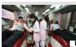
春節前急募熱血 最缺A型和 ...