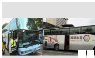
消保處抽檢遊覽車滅火器 不 ...